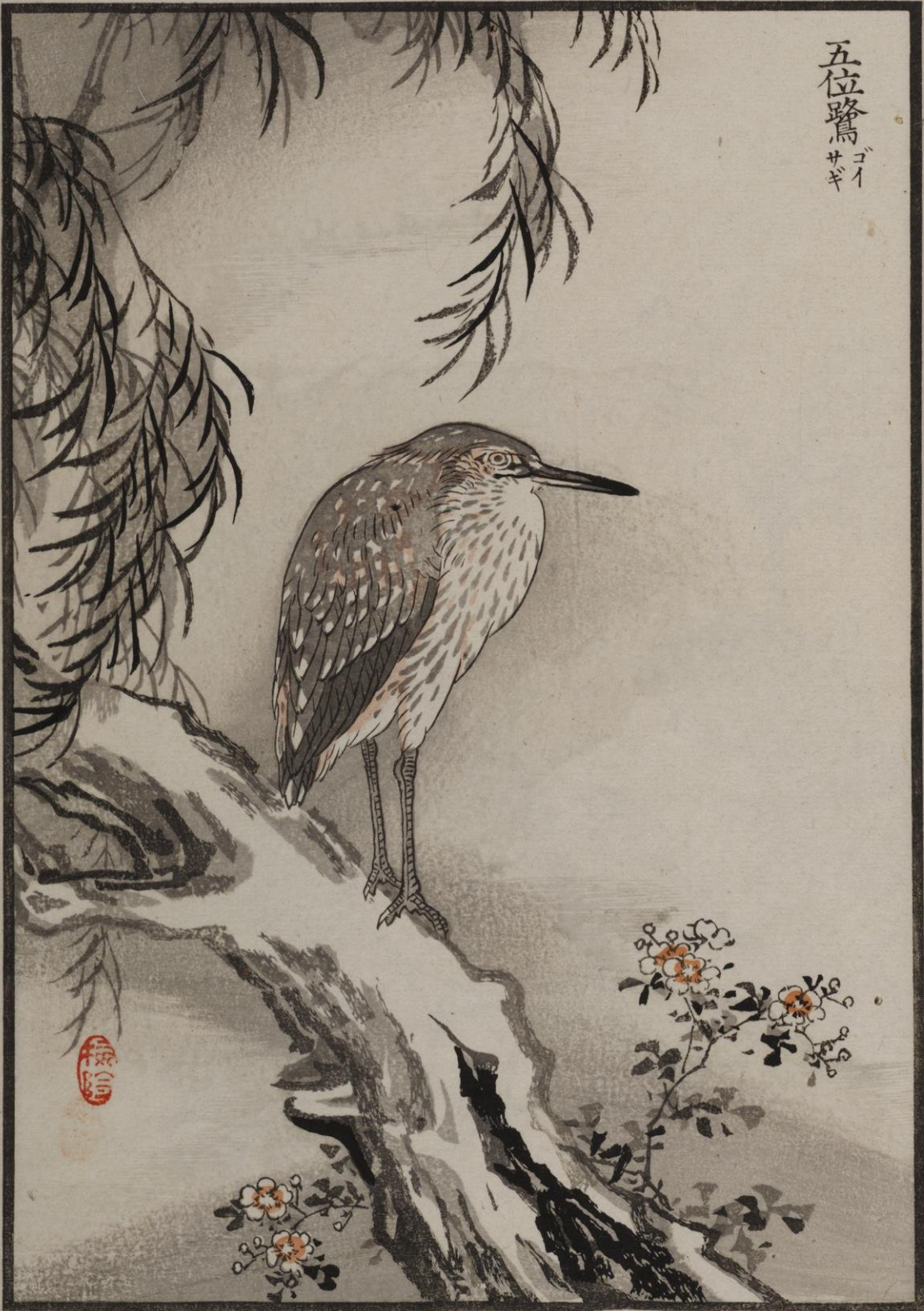
五位鷺 ゴイ サギ