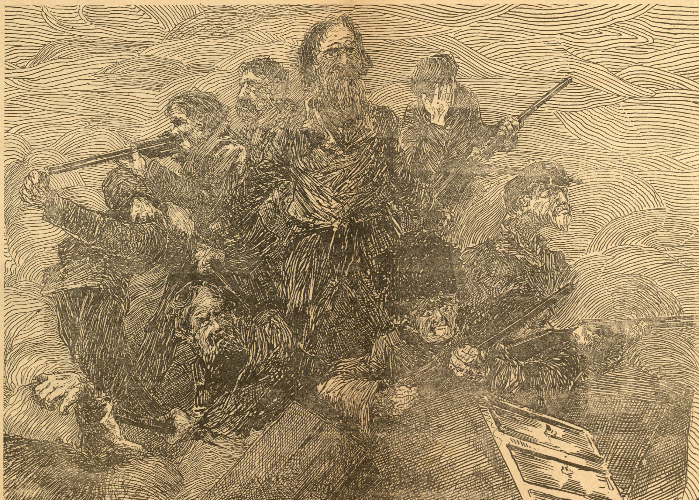
Н А Б А Р Р И Ъ А Д А Х Ъ.