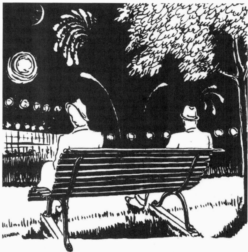
Drawing from the Finnish magazine Eeva , which published Ruth Berlau's short story "Tivoli Guests" in Finnish translation as "Ilta Tivolissa" in December of 1940 under the pseudonym Maria Sten