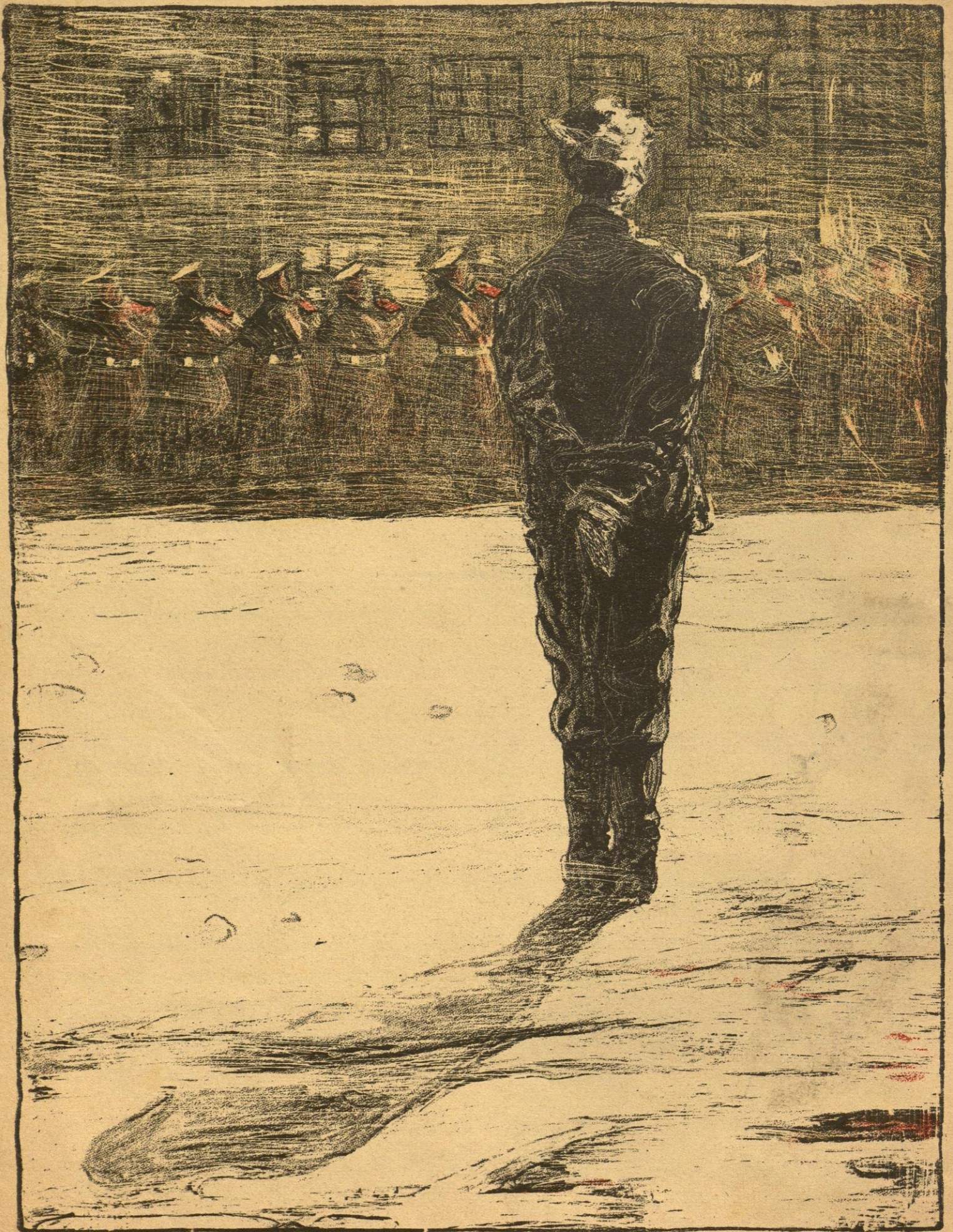
Рис. А. И. Вахрамѣева.