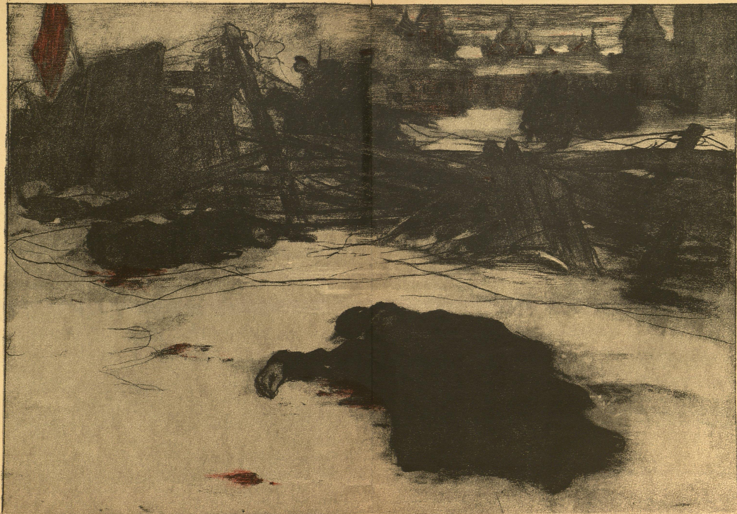
И. С. Горюшинъ-Сорокопудовъ.