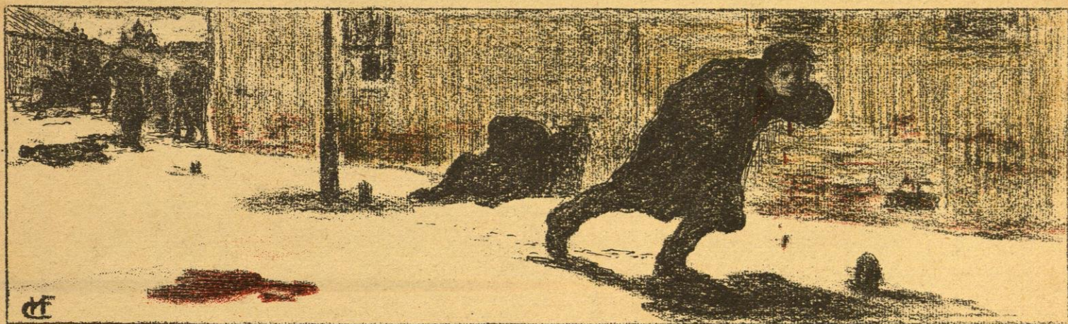
И. С. Горюшкинъ-Сорокопудовъ.